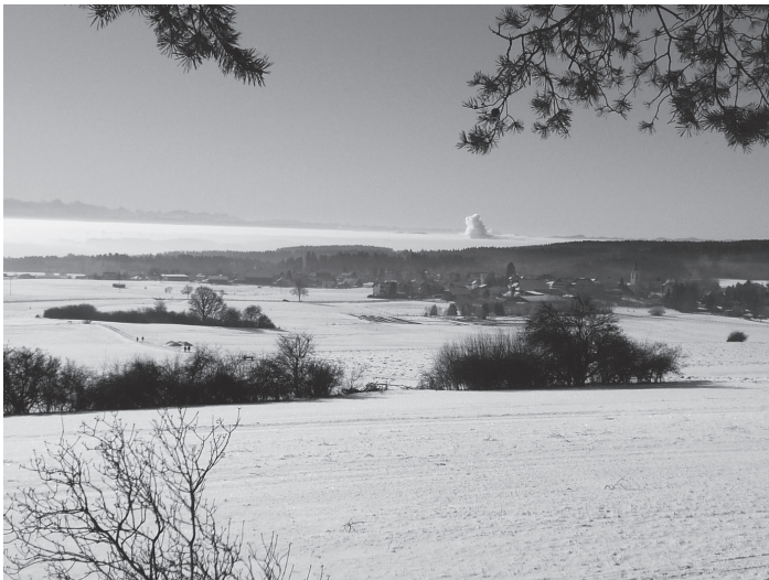
Blick von Brenden Richtung Schweiz