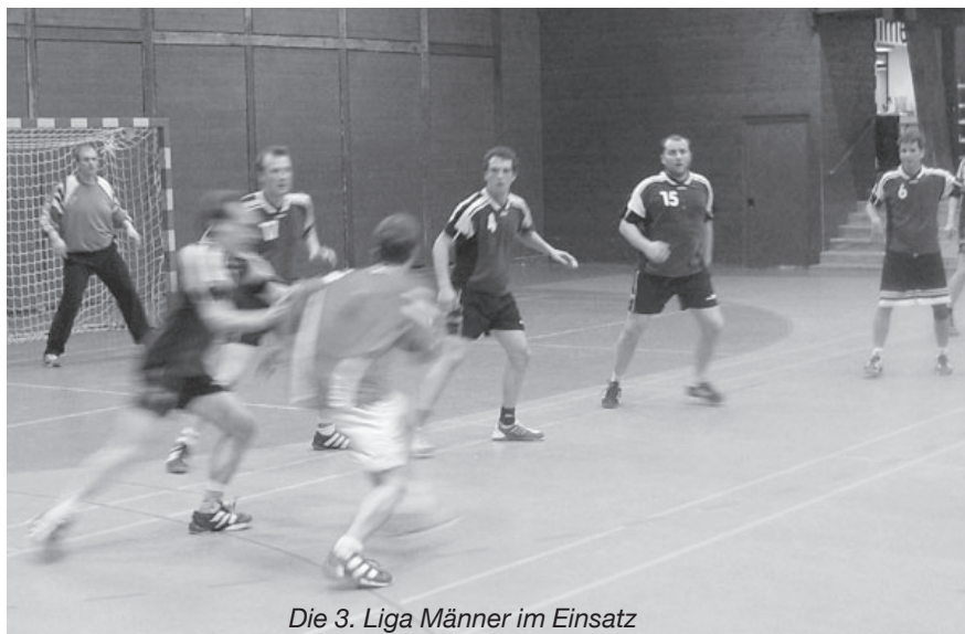
Die 3. Liga Männer im Einsatz